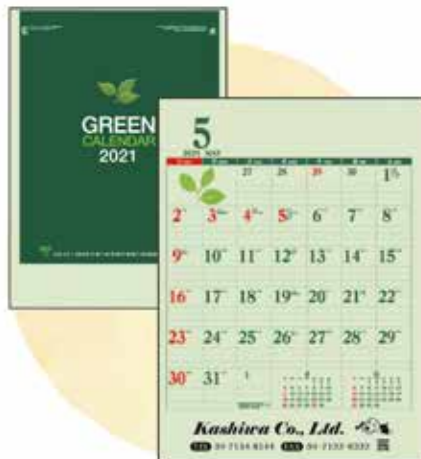
グリーンカレンダー