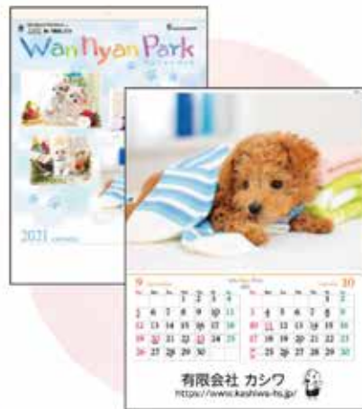
ワンニャン・パーク

他にも沢山の種類のカレンダーをご用意しております。また、1から作成する完全オリジナルカレンダーも作成できますので、お気軽にお問い合わせくださいませ!