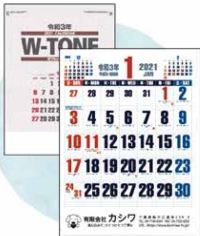
ダズルトーン文字